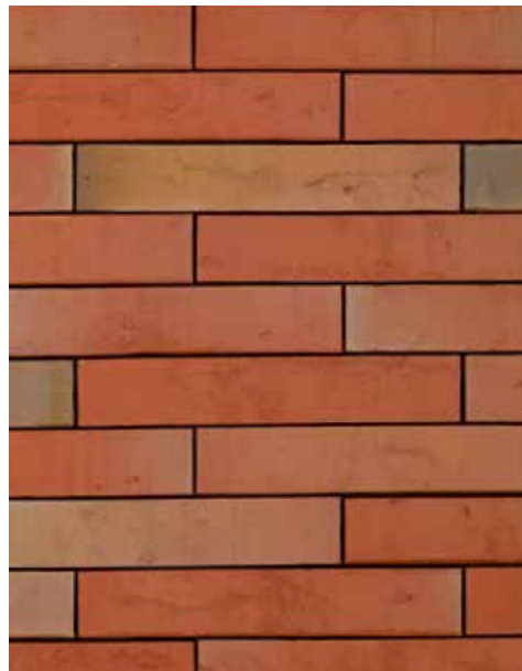
Linnaeus Robinia Formaat ± 288x90x48 mm Eco-brick ± 288x65x48 mm