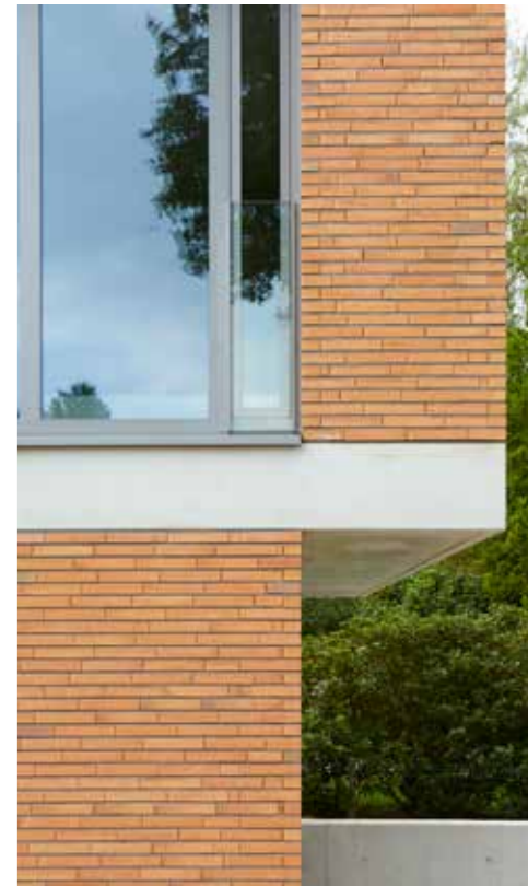
Team 80 architecten, Antwerpen