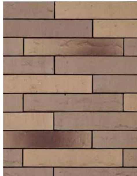
Linnaeus Salix Formaat ± 288x90x48 mm

Uitzicht: genuanceerd Kleurtint: rood genuanceerd, met grijsgetinte reductiekleur met groengrijze-blauwgrijze schakering Oppervlaktetextuur: onbezand, 'Wasserstrich'-look, met persboord Aspect: mat & geflasht