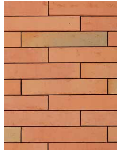
Linnaeus Betula Formaat ± 288x90x48 mm

Uitzicht: genuanceerd Kleurtint: rood genuanceerd, met grijsgetinte reductiekleur met groengrijze-blauwgrijze schakering + 10% oranjegetinte stenen Oppervlaktetextuur: onbezand, 'Wasserstrich'-look, met persboord Aspect: mat & geflasht