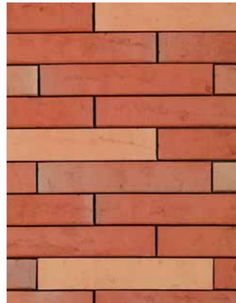
Linnaeus Tilia Formaat ± 288x90x48 mm

Uitzicht: genuanceerd, beperkt aandeel met matzwarte engobering Kleurtint: lichtgrijs-bruin Oppervlaktetextuur: onbezand, 'Wasserstrich'-look, met persboord Aspect: mat & geëngobeerd